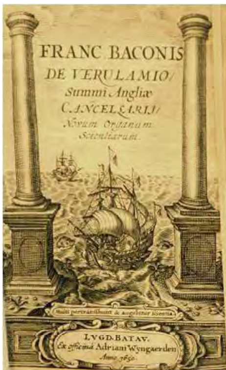
Figura 1. Portada de la primera edició (1620) del Novum Organum , de Francis Bacon.

observació, hipòtesi, contrast (de la hipòtesi) i tesi. La observació pot ser qualitativa o quantitativa, pròpia de l'investigador o be – especialment des de la generalització de les revistes científiques – procedent de la literatura especialitzada. La hipòtesi és la proposició que es pren com a explicació provisional d'un fenomen, és a dir, una suposició. La hipòtesi pot portar subordinades altres hipòtesis, i també preguntes. Per exemple, si acceptem seqüencialment les hipòtesis «L'home prehistòric manufacturava eines» i «Les eines que manufacturava l'home prehistòric podien ser de material lític», hom pot llavors plantejar la pregunta «Quins materials lítics utilitzava l'home prehistòric per a manufacturar eines?». Per la seva part, el contrast d'una hipòtesi pot ser experimental, matemàtic o be una barreja d'ambdós, la qual cosa ocorre molt sovint. En el contrast de tipus experimental,