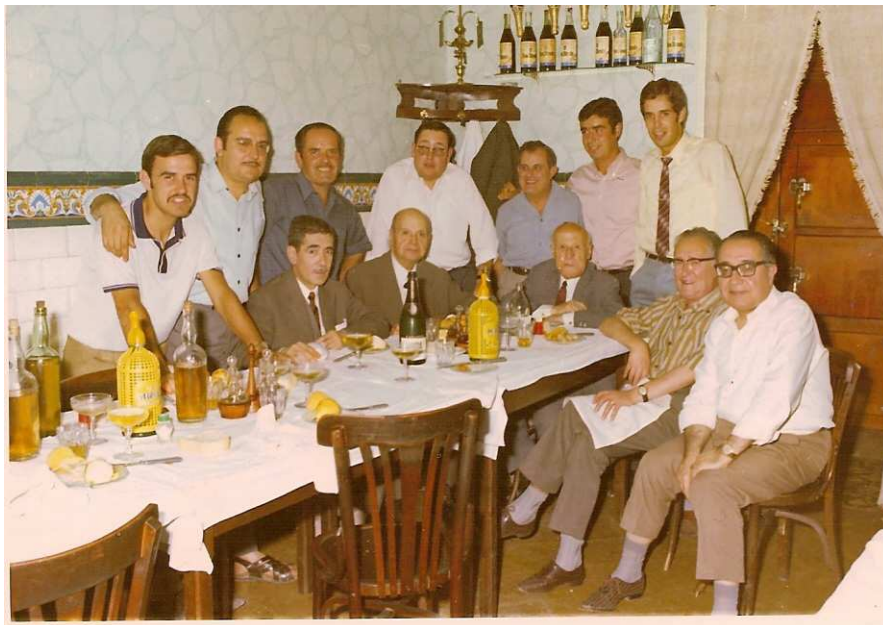
Sopar dels empleats del banc de Vall l'any 1968

El 1942, un cop arribat a Montblanc es posà a treballar al Banc de Valls, on treballarà fins a la seva jubilació. Passarà per tots els llocs fins arribar a apoderat de caixa i es jubilarà el dia 30 de Novembre de 1981.