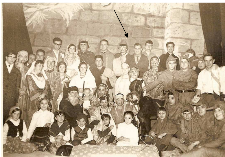
Quadre artístic dels Pastorets l'any 1966

Col·laborà en la representació de "Els Pastorets" des de 1942 fins a la seva mort.