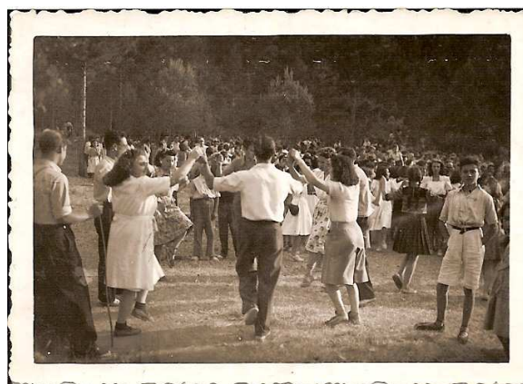
Instantànies de l'Aplec de la Vall

L'any 1947 és uns dels fundadors del Casal Montblanquí, on desenvolupa una activitat cultural remarcable formant l'Esbart Dansaire i l'Orfeó Montblanquí.