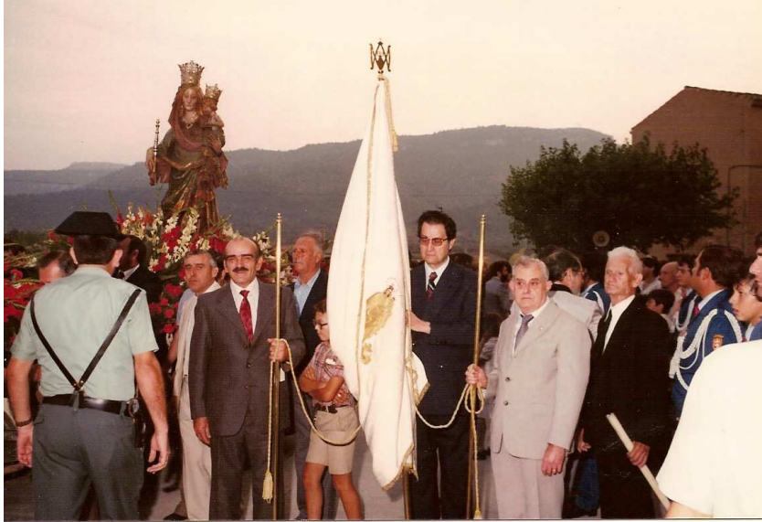
Portant la Bandera del Santuari de la Serra l'any 1981