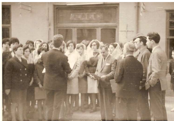
Cantant Caramelles amb l'Orfeó Parroquial

Col·laborà a Radio Montblanc durant els anys 50 i 60, on setmanalment ofería el temps sota el pseudònim de “L'Ermità de Sant Joan”. Posteriorment col·laborà amb Radio Montblanc “La Veu Jove de la Conca”, on diàriament passava els comentaris dels temps.