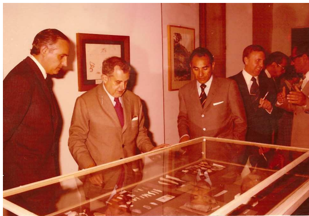
Visita de les Autoritats al Museu Arxiu l'any 1968