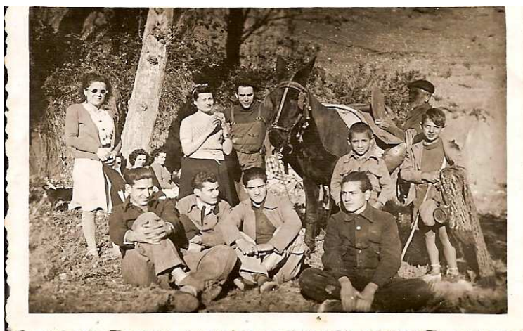
Pujant la campana "Topo de tren" a Sant Joan el 11 de Novembre de 1945